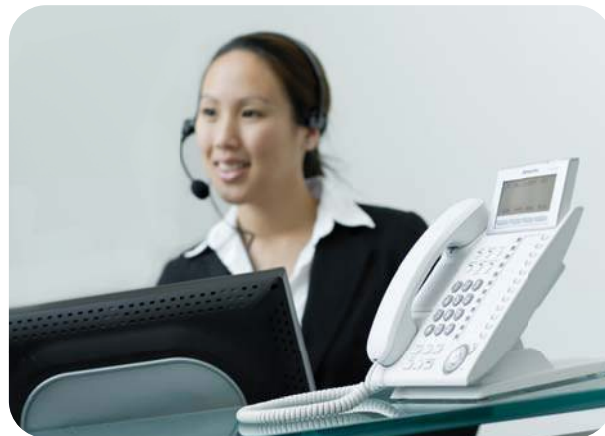
RECEPTIONIST GEBRUIKT COMMUNICATION ASSISTANT

De Operator Console ondersteunt ook de volgende aanvullende opties: