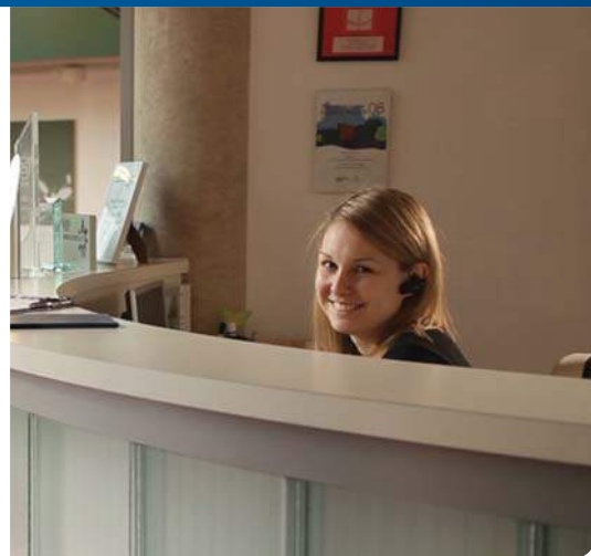
COMMUNICATIONS ASSISTANT BROCHURE