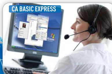
CA BASIC EXPRESS

EEN TELEWERKER DIE EEN SOFTPHONE GEBRUIKT