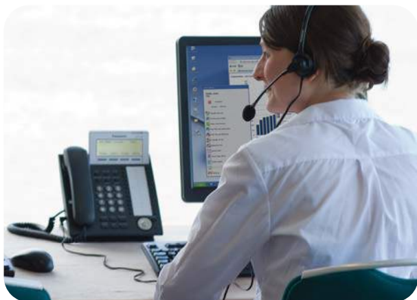
CA - BIEDT UNIFIED COMMUNICATIONS